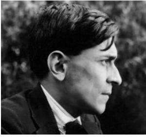
何塞·卡洛斯·马利亚特吉，秘鲁共产党建立者

随着一系列共产党放弃马克思主义，全面转向议会道路，而且，主要的是，随着古巴革命在1959年胜利，政治-军事组织开始在拉丁美洲出现了。这一部分的革命者想要找到继续向帝国主义进行武装斗争的出路。